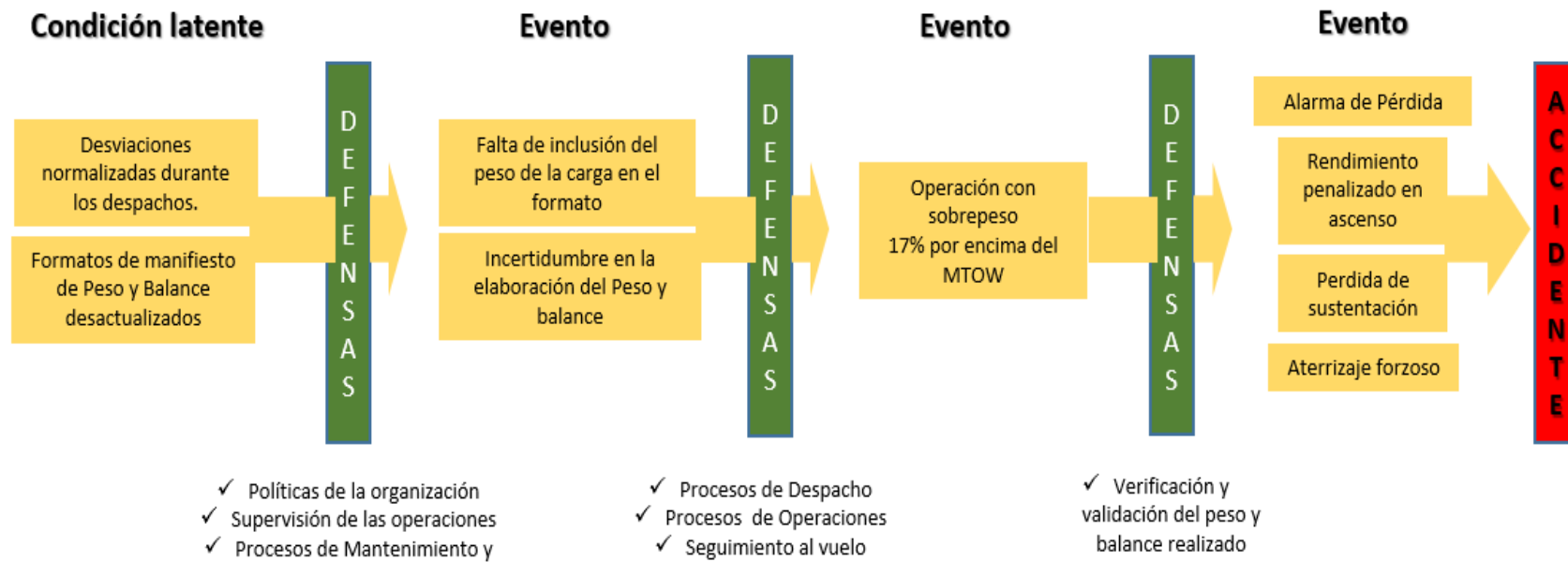
Figura No. 2 – Cadena de eventos accidente HK3804