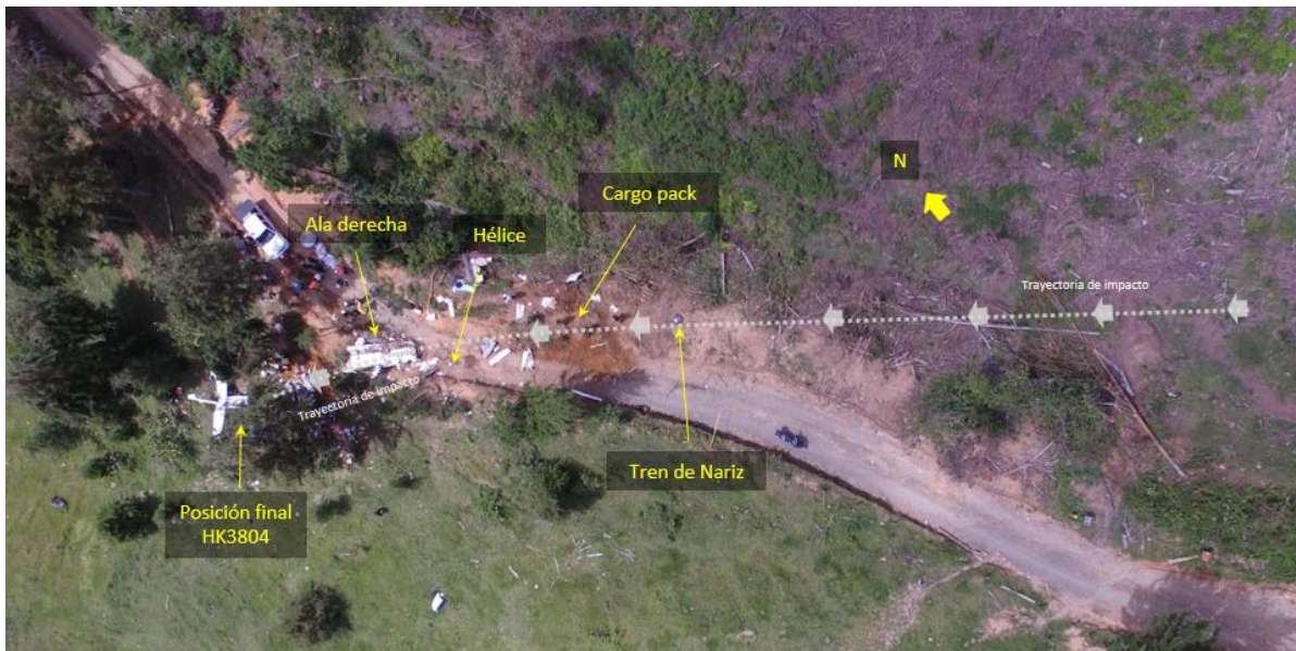
Fotografía No. 2 – Panorama general del sitio del accidente

Posteriormente, a 16 metros, se evidenció el impacto de la hélice, de la parte frontal de la aeronave y del ala derecha. En este impacto, se produjo la separación de la hélice y el desprendimiento del ala derecha. La aeronave continuó con la inercia del impacto y chocó finalmente a 18 metros con la sección frontal izquierda contra un árbol ubicado en coordenadas N06^{\circ}12'52.09'' - W75^{\circ}39'18.28'' . Este impacto final provocó el cambio de rumbo abrupto de colisión que finalizó en rumbo 088^{\circ} hasta finalmente detenerse.