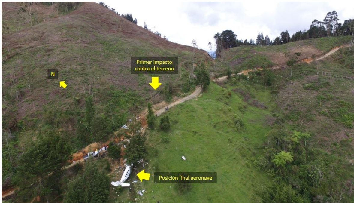
Fotografía No. 3 – Vista lateral del sitio del accidente

El examen realizado a los controles de vuelo determinó que todas las fracturas en el sistema se dieron como consecuencia de fallas por sobrecarga, debido a la dinámica del impacto. No existieron indicaciones de una discontinuidad pre existente en el sistema de controles de vuelo.