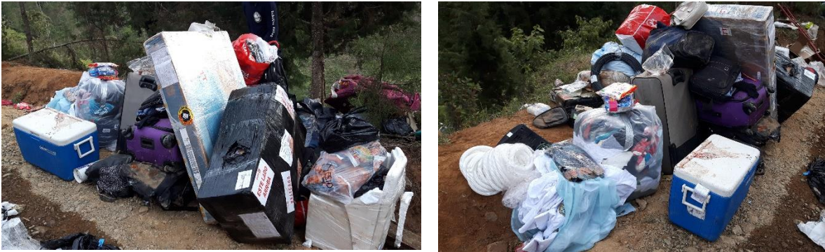
Fotografías No. 4 y 5 – Carga recuperada de la aeronave HK3804