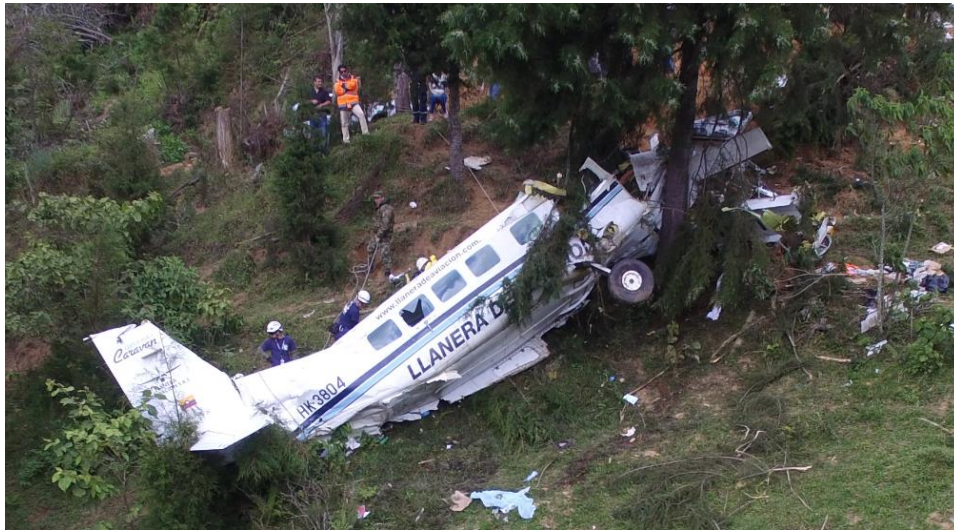
Fotografía No. 1 – Estado final de la aeronave HK3804

Siguiendo los lineamientos internacionales y nacionales en investigación de Accidentes aéreos (Anexo 13 OACI) - (RAC 114), Colombia como Estado de Suceso realizó la Notificación de la ocurrencia a la National Transportation Safety Board (NTSB) de los Estados Unidos de América, como Estado de fabricación de la aeronave, y a la Transportation Safety Board (TSB), de Canadá como estado de fabricación de la planta motriz.